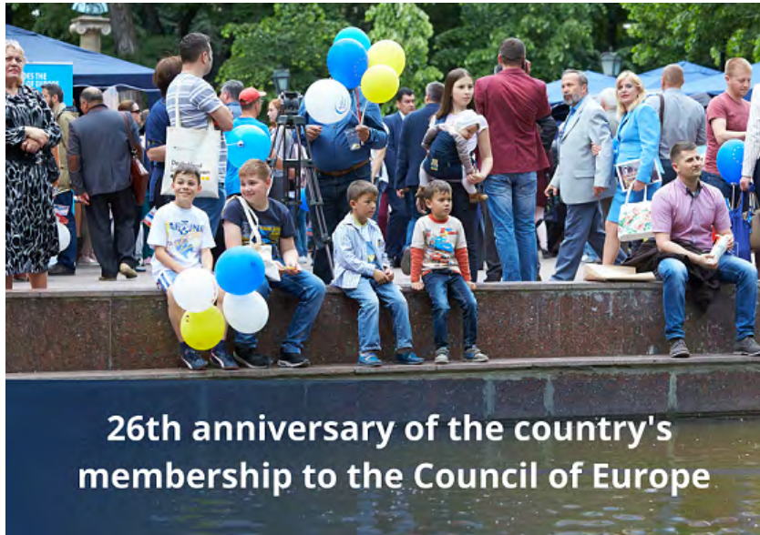
26th anniversary of the country's membership to the Council of Europe

La 13 iulie curent s-au împlinit 26 de ani de când Republica Moldova a devenit membru cu drepturi depline al Consiliului Europei la 13 iulie 1995 - cea mai importantă organizație pentru drepturile omului din Europa.